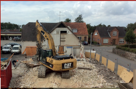
Nedrivning af bygningen i august 2017.