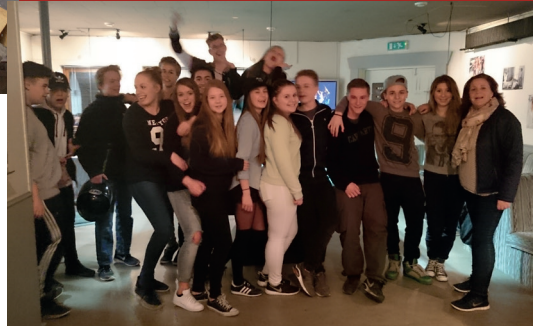
De unge i klubben, da projektet fik de første penge fra Realdania.

Efter 32 år som ungdomsklub på Møllevej 22 i Idestrup, skulle den gamle bygning, der tidligere havde været bl.a. brugsforening, rives ned. Bygningens tilstand var for dårlig og kommunen ønskede at afhænde den. Det kunne Idestrup ikke lade ske!